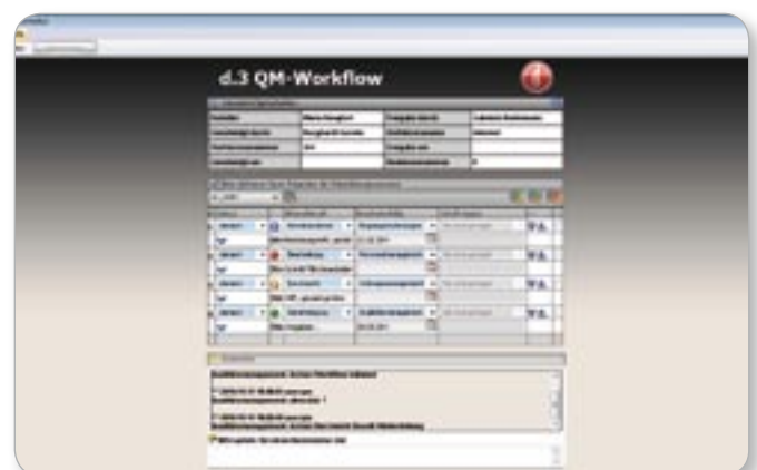
Das dvelop-Qualitätsmanagement steuert per Workflow alle QM-Prozesse – mit automatischer Benachrichtigung und Überwachung von Lesebestätigungen.